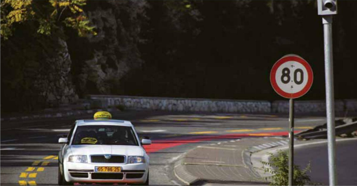
החלטה התקבלה לאחר ביקורת של יו"ר ראש המועצה הלאומית לבטיחות בדרכים. ממונות מהירות בכביש ביעניחו